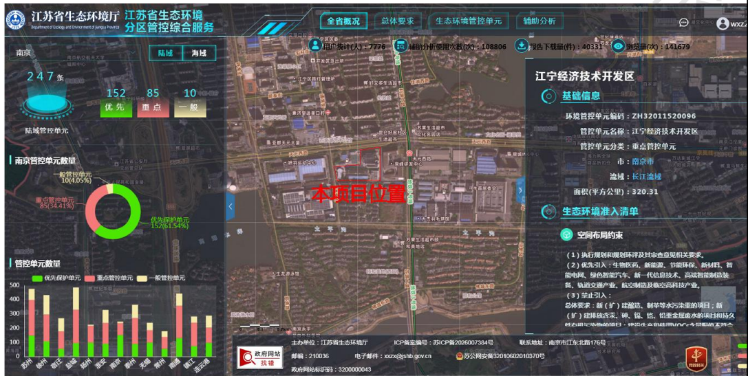
图 1-1 江苏省生态环境分区管控服务平台查询结果

经查询江苏省生态环境厅发布的江苏省生态环境分区管控服务平台 ( http://ywxt.sthjt.jiangsu.gov.cn:8089/sxydOuter/#/Homepage )，本项目位于江宁经济技术开发区，属于重点管控单元，本项目所在地在江苏省生态环境分区管控综合服务系统中的位置如下图所示：